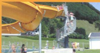
Badespaß in Leonstein